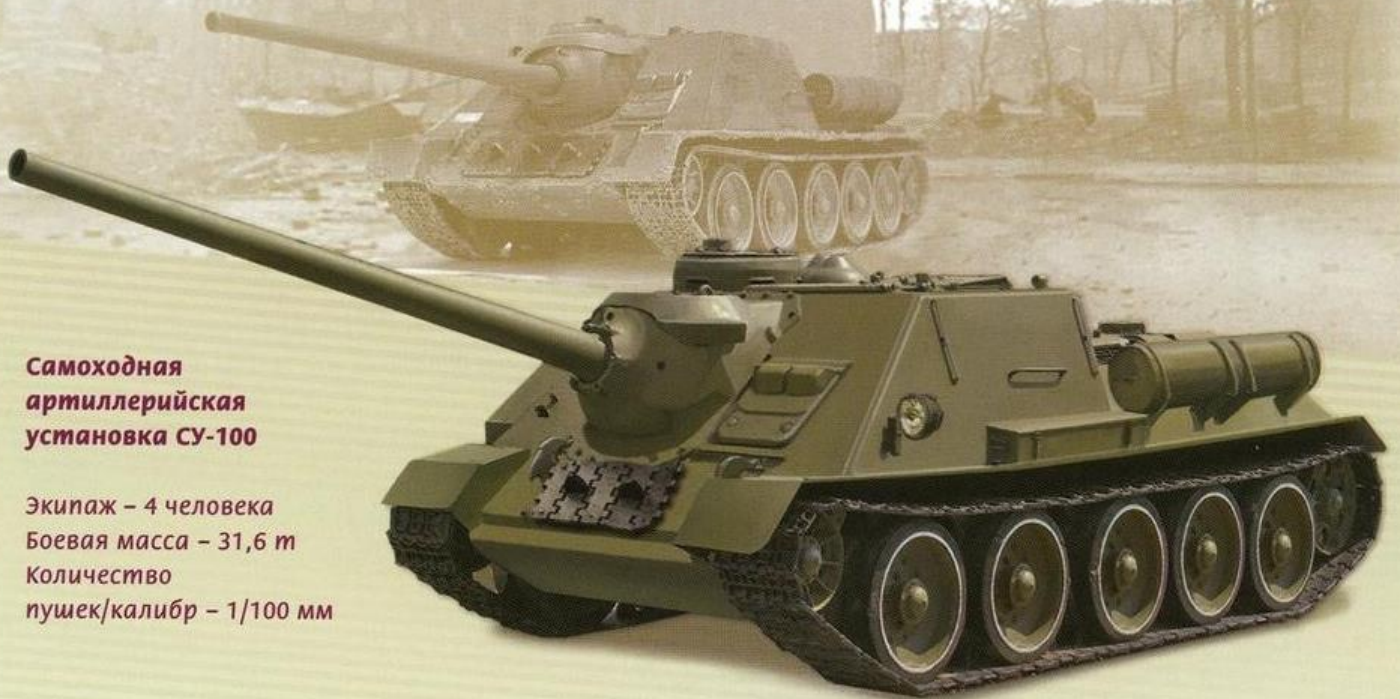
Самоходная артиллерийская установка СУ-100

Экипаж – 4 человека Боевая масса – 31,6 т Количество пушек/калибр – 1/100 мм