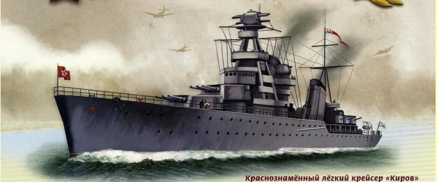
Краснознамённый лёгкий крейсер «Киров»

Водоизмещение — 9550 т; длина — 191 м, ширина — 17,7 м Вооружение: 9 x 180 мм, 6 x 100 мм, 3 x 45 мм и 14 x 37 мм орудий, 8 x 12,7 мм пулемётов, 2 x 533 мм торпедных аппарата, 164 мины, 2 бомбосбрасывателя, принимал на борт 100 якорных мин Скорость хода — 36 узлов, экипаж — 881 человек