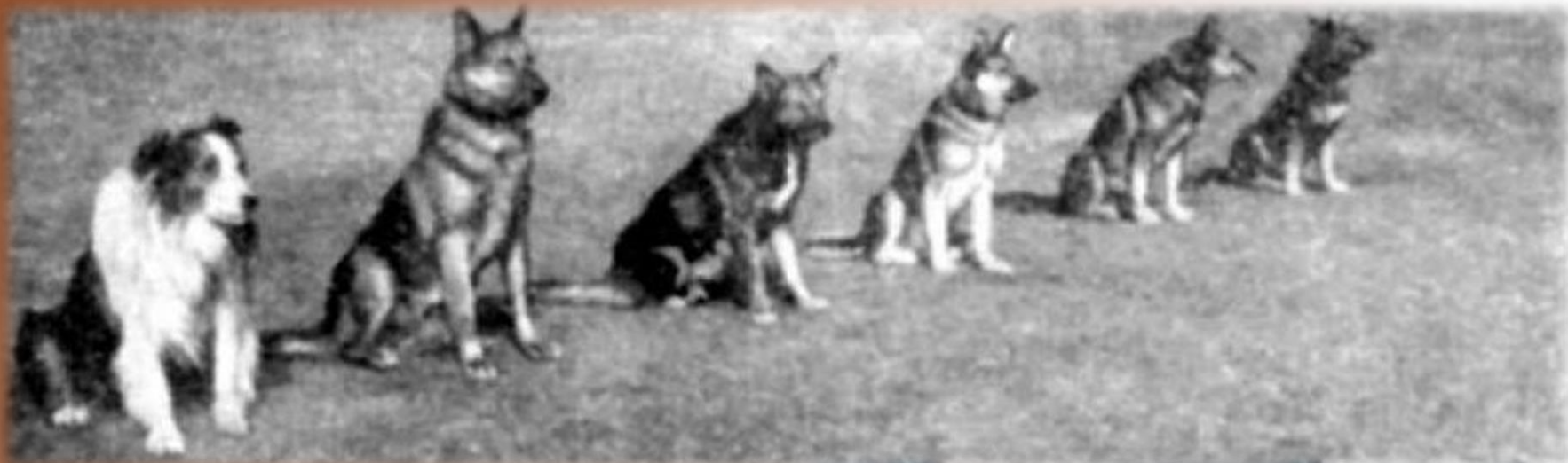
Собаки-миноискатели Дик, Джек, Жук, Дейка, Инга, Миг

Дик стойко переживал блокаду, не пугался взрывов, работая на переднем крае обороны. Судьба Дика сложилась вполне счастливо. Он дожил до конца войны, продолжая нести опасную службу, и, судя по итогам собачьей выставки 1945 года, где Дик получил оценку "хорошо", оставался в прекрасной форме.